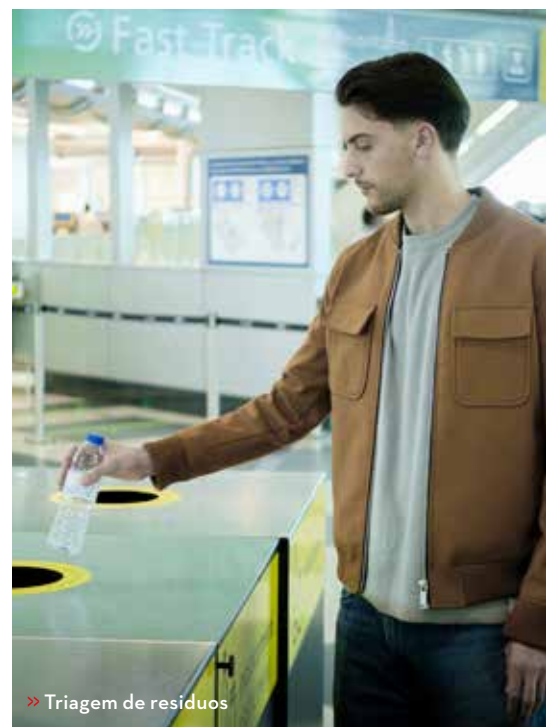
» Triagem de resíduos