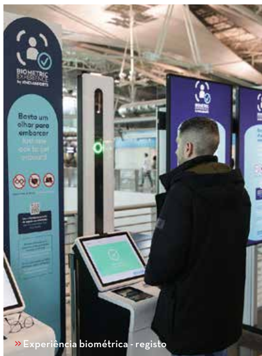
» Experiência biométrica - registo