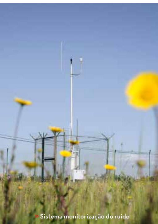
» Sistema monitorização do ruído

A ANA REFORÇA A POSIÇÃO DE LIDERANÇA NA DESCARBONIZAÇÃO DO SECTOR DA AVIAÇÃO, ATRAVÉS DE MEDIDAS CONCRETAS E EFICAZES PARA REDUZIR AS NOSSAS EMISSÕES DE CARBONO