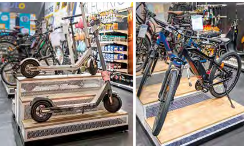
Imagem de modelo de trotinete Xiaomi Mi.

Bicicletas, trotinetes, acessórios, toda uma gama de produtos dedicados à mobilidade urbana que o convidamos a conhecer em qualquer centro Norauto ou em norauto.pt